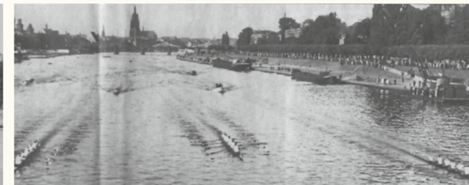
19.8.1928 - Traditionelle Frankfurt-Regatta

» Sport im Main: Schwimmen, Wasserspringen, Wasserball, Tauchen, Rettungsschwimmen, Angeln, Sportangeln