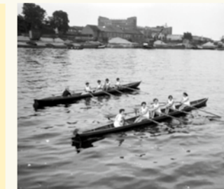
Frauenvierer - im Hintergrund Großmarkthalle

» Sport im Main: Schwimmen, Wasserspringen, Wasserball, Tauchen, Rettungsschwimmen, Angeln, Sportangeln