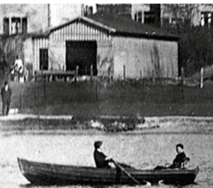
1. Ruderhaus des RC Griesheim 1906

» Seit 1608 haben der Main und seine Ufer von Höchst bis Oberrad Menschen in 30 Sportarten erlebt.