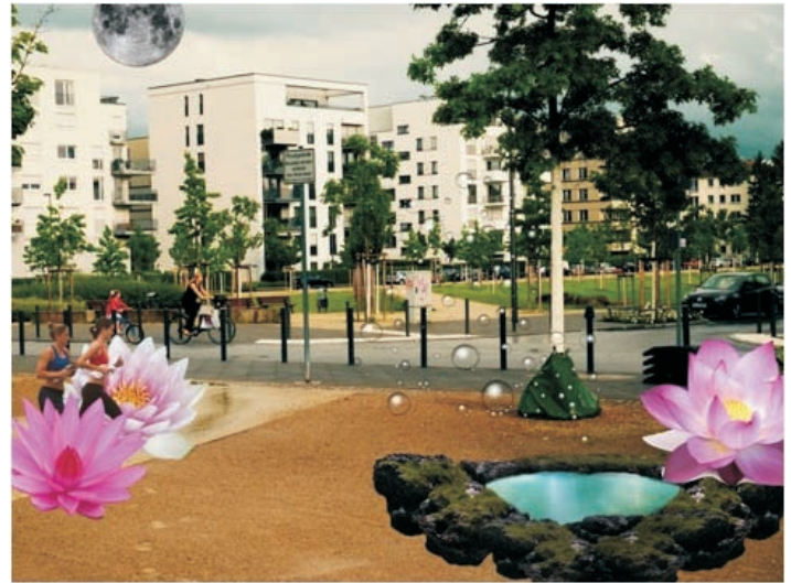
Grafik: Miriam Coretta Schulte

Samstag, 01.09. 16:00 & 19:30 Uhr Sonntag, 02.09. 12:00, 16:00 & 20:00 Uhr Dauer: ca 75 Min.